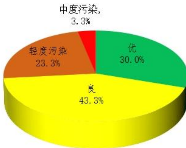
图 3 2023 年 6 月鄂州市区空气质量比例图