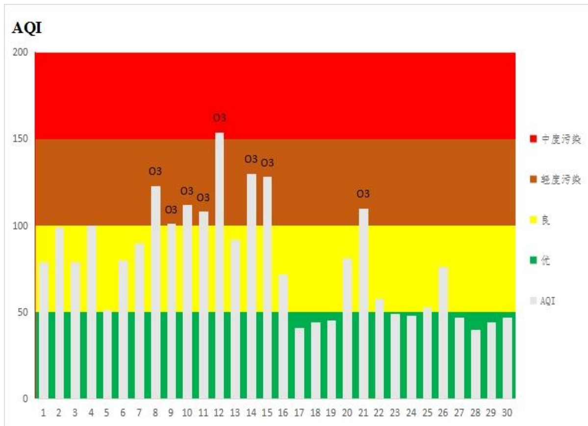
图 2 2023 年 6 月鄂州市区空气质量指数分布图

的天数 21 天。6 月份鄂州市城区空气质量指数（AQI）最大值 154（6 月 12 日），最小值 40（6 月 28 日）。6 月份市区环境空气质量指数和空气质量状况所占比例见图 2 和图 3。