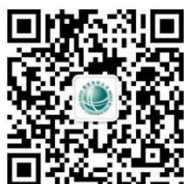
网上国网 95598 微信公众号