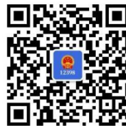
12398 能源监管 热线微信公众号